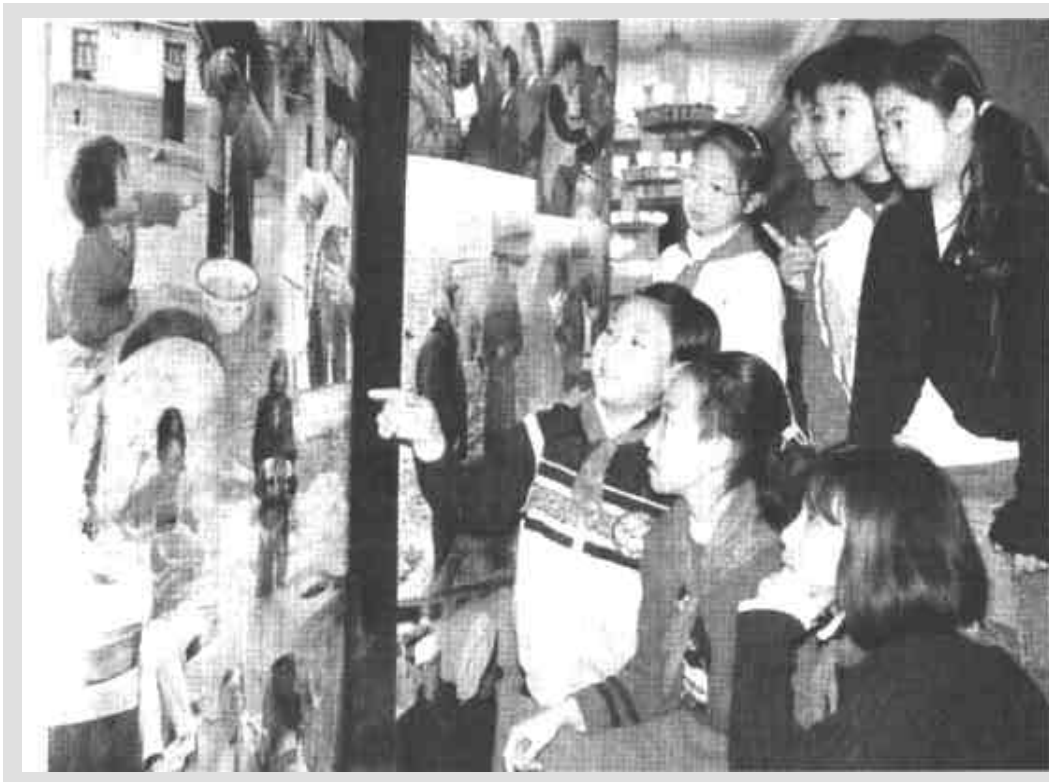
12月27日,北京育英学校学生观看“母亲水窖”展览。当日,由中国妇女发展基金会、世界华人社团联合会共同举办的“世界华人爱心汇聚 共建母亲水窖”行动大会在北京人民大会堂举行。

据了解,广东省已迅速组织开展了流行病学调查,积极采取措施对患者居住的环境、活动场所进行了严格的消毒,对密切接触者进行了隔离和医学观察。至今为止,与患者密切接触者均无发热等异常表现。