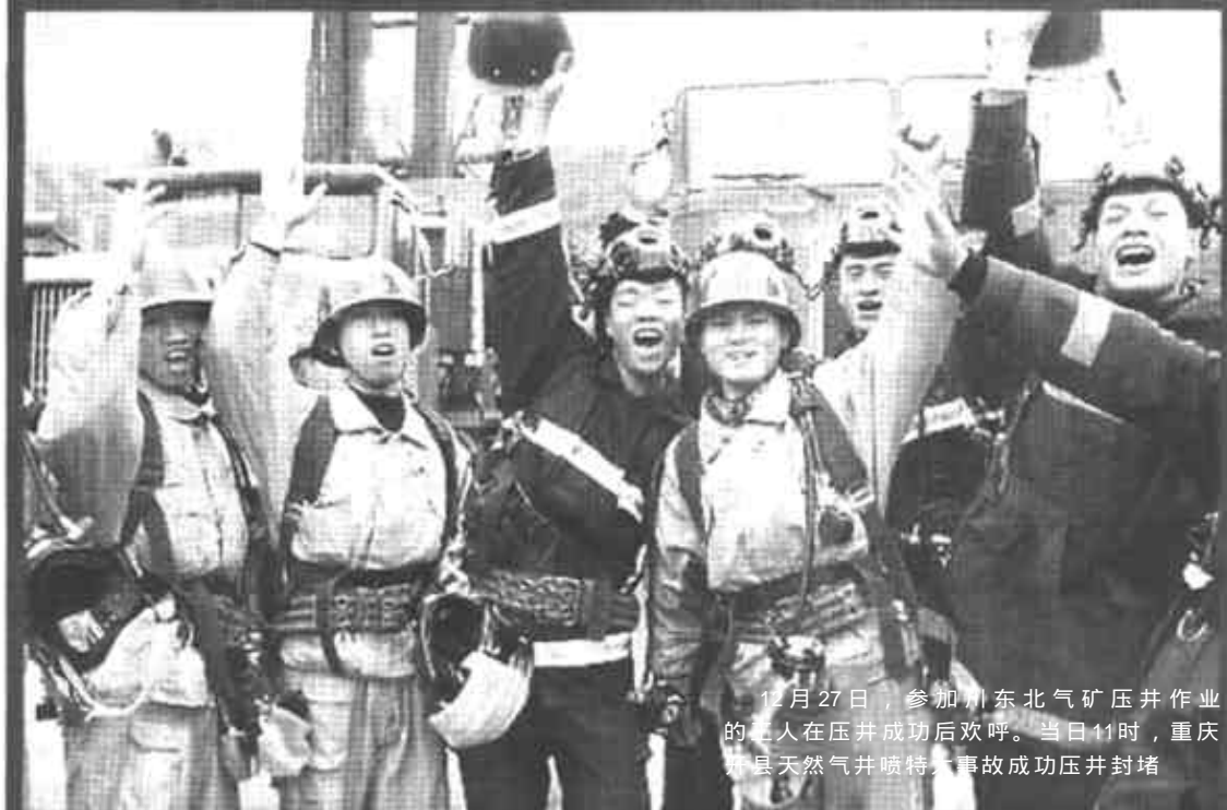
12月27日，参加川东北气矿压井作业的工人在压井成功后欢呼。当日11时，重庆开县天然气井喷特大事故成功压井封堵。

施工人员实施压井。9点28分，开始关闭防空管闸门。9点36分，正式开始灌浆压井。9点46分，现场总指挥、中国石油天然气集团公司总经理马富才向国务委员兼国务院秘书长华建敏报告：“压井基本成功！” 27日11点，川东北气矿16H井井喷宣告压井封堵成功。肆虐的毒气不再蔓延，做好消毒及其他工作后，当地群众将可以回到自己的家园。 目前，开县灾区4万多名被转移疏散的群众已基本得到妥善安置。武警重庆总队对遇难者遗体及动物尸体的搬运清理工作也将在28日结束。 “12·23”井喷事故牵动着全国人民的心。事故发生后，开县县委县政府收到来自全国各地的数十件慰问电和慰问信，港澳台海外华侨也纷纷致电表示问候。此外，包括开县各乡镇和全国各地的救灾物资源源不断地运往重庆开县灾区，及时分发给灾民手中。 四川石油管理局局长、党委书记陈应权27日介绍，针对川东北气矿“12·23”井喷特大事故，四川石油管理局痛定思痛，决心狠抓安全生产，杜绝同类事故的再次发生。