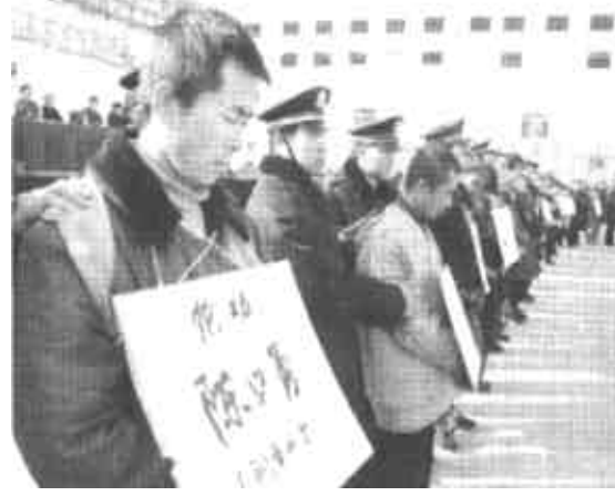
昔日为非作歹的犯罪嫌疑人低下了头。

据了解，此次公开处理大会，是公安机关为推动中心城区冬季“严打”整治斗争继续深入，创造“严打”斗争的强大声势，教育广大人民敢行、善于同犯罪分子作斗争而举行的。公开处理大会的举行，广大市民拍手称快，犯罪分子闻风丧胆，打击了违法，震慑了犯罪，为市民度过欢乐祥和的“两节”创造了良好的社会治安环境。（开言 春兴）