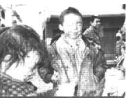
12月25日，中石油川东北气矿发生“井喷”事故。两名儿童的眼睛被有毒气体伤害。

施工人员实施压井。9点28分，开始关闭防空管闸门。9点36分，正式开始灌浆压井。9点46分，现场总指挥、中国石油天然气集团公司总经理马富才向国务委员兼国务院秘书长华建敏报告：“压井基本成功！” 27日11点，川东北气矿16H井井喷宣告压井封堵成功。肆虐的毒气不再蔓延，做好消毒及其他工作后，当地群众将可以回到自己的家园。 目前，开县灾区4万多名被转移疏散的群众已基本得到妥善安置。武警重庆总队对遇难者遗体及动物尸体的搬运清理工作也将在28日结束。 “12·23”井喷事故牵动着全国人民的心。事故发生后，开县县委县政府收到来自全国各地的数十件慰问电和慰问信，港澳台海外华侨也纷纷致电表示问候。此外，包括开县各乡镇和全国各地的救灾物资源源不断地运往重庆开县灾区，及时分发给灾民手中。 四川石油管理局局长、党委书记陈应权27日介绍，针对川东北气矿“12·23”井喷特大事故，四川石油管理局痛定思痛，决心狠抓安全生产，杜绝同类事故的再次发生。