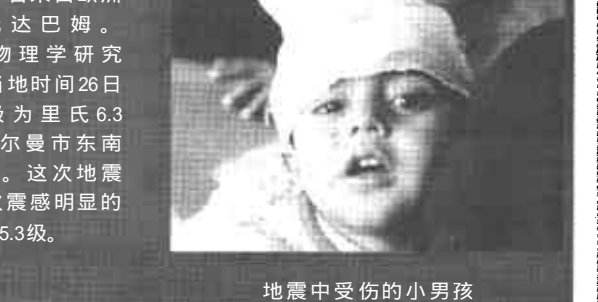
地震中受伤的小男孩