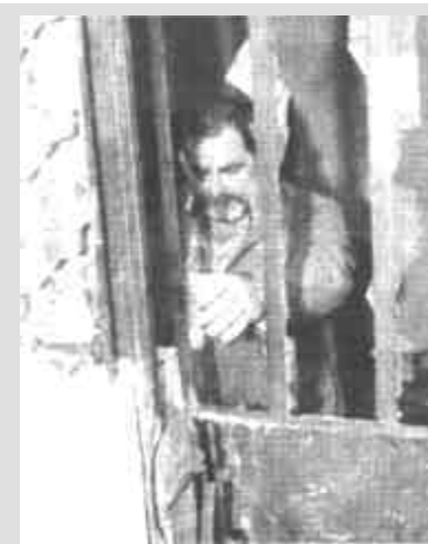
12月27日,巴格达市民里检查遭美军搜查时被破坏的房门。里家的家12月26日晚遭到美军搜查,当时家中只有他的妻子和四个孩子。

据新华社安卡拉12月26日电 土耳其官方26日宣布破获上月在土耳其最大城市伊斯坦布尔发生的连环爆炸案,并确认实施这次恐怖袭击的团伙与“基地”组织有牵连。伊斯坦布尔市长居莱尔在当天举行的新闻发布会上说,土耳其境内一个为“基地”组织的组织实施了上月的自杀式爆炸。这个组织现已被破获。他说,土警方已经逮捕了这个组织的大部分成员,但仍有至少5名成员逃到了土耳其境外。