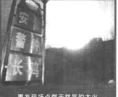
事发现场点燃天然气的大火