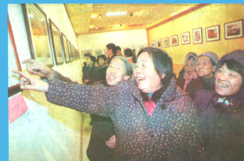
12月27日,由山东省新闻摄影学会主办的“金秋时节看大王”——记者摄影一日作品展在广饶县大王镇开幕,展出的100余幅作品是由来自全省二十多家新闻单位的摄影记者用一天时间拍摄的。大王镇男女老少涌入展厅,争相观看,无不为产值过百亿元的家乡巨变而自豪。

人以文造假欺骗作者的丑恶本质,而且亵渎了作者本人的品质,在社会上造成了不良影响。这与大街上办假证的广告又有何区别呢? 论文类“奖品”之风却也迎合了一小部分人偷窃劳动成果,卖弄文笔的不正之风,也有为了捞到政治资本或经济利益,让一些不学无术,庸学之材占了便宜。同时,颁奖单位也发了一笔不小的不义之财。就按今年成都某单位制作的特等奖中奖价格来算,每485元的制作费,成本连185元都用不了,净赚300元,如果有1000人收到后上当,将有约30万元的净收入落入腰包,制假者的黑利润不比街上假证贩子赚得少。 (王连杰)