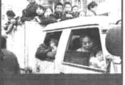
12月27日11时30分，重庆开县正坝镇居民陆续开始返回家园。