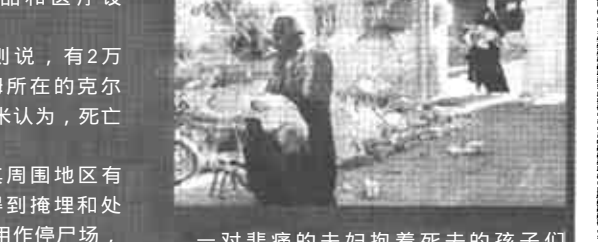
一对悲痛的夫妇抱着死去的孩子的尸体